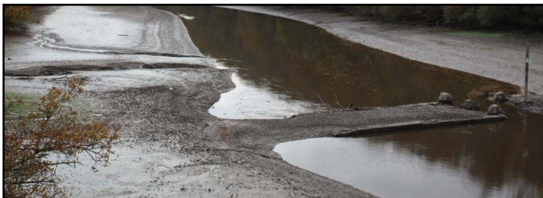
Pont de la République (niveau au plus bas)