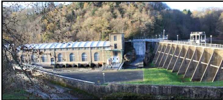
La Roche qui boit